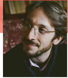
NICOLAS D'ESTIENNE D'ORVES

C'est à vingt ans, le 13 mai 1958, jour du retour au pouvoir du général de Gaulle, que, stagiaire à l'Institut français de presse et se trouvant par hasard sur les bancs des journalistes à l'Assemblée nationale, Michèle Cotta est plongée d'un coup au cœur d'une actualité qui se confond avec la grande Histoire. Peu après, recrutée par le service politique de L'Express , elle deviendra familière de tous les acteurs de la vie politique, gaullistes ou pas, et plutôt de gauche. Leurs vies, leurs itinéraires politiques surtout, la passionnent et l'intriguent. Elle les raconte dans ce premier tome de ses mémoires.